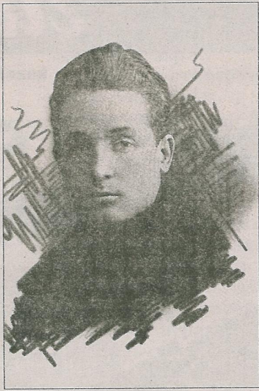
Кузьма Чорны. 1925 г.

Літаратурна-музычнае свята «Цімкавіцкія вытокі» – цудоўны прыклад ушанавання памяці пісьменніка. Яно было прасякнута тэмай родных каранёў, захавання любові да сваіх продкаў, землякоў, бацькоўскага дому. Вельмі душэўна і шчыра сучасныя цімкаўцы ставяцца да асобы Кузьмы Чорнага. Імя